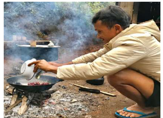
Projet en cours de financement 2020 région nord de Chiang Mai village de Kalu Réalisation de 5 blocs sanitaires - Réalisation de 5 rocket stove, afin d'avoir de l'eau chaude