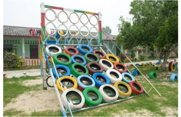
Projet réalisé en 2019 près de Mae Wan Création d'un espace de jeux extérieur avec matériaux de récupération