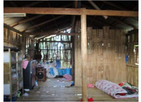
Projet réalisé en 2018 près de Mae Sai Réfection et réhabilitation d'une maison d'habitation