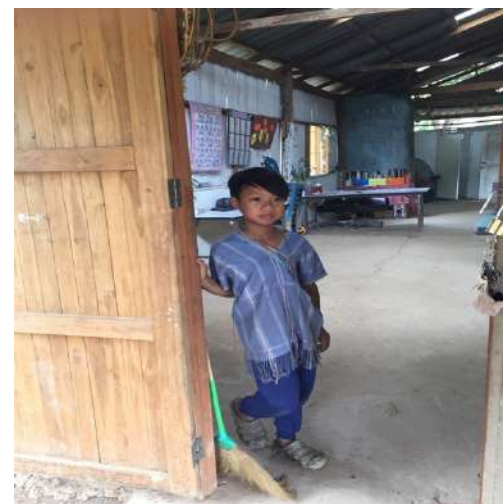
Elèves et enseignante de la classe au village de Tong région Chiang Mai 12 élèves de 4 à 14 ans – 1 enseignante 2 fois par semaine

Projet en cours : Réfection & réhabilitation des extérieurs et des intérieurs de la classe