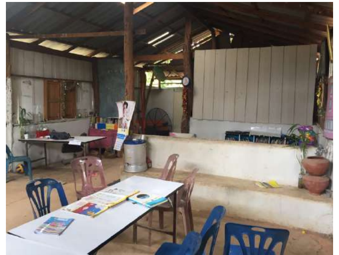
Salle de classe au village de Tong région Chiang Mai 12 élèves de 4 à 14 ans – 1 enseignante 2 fois par semaine