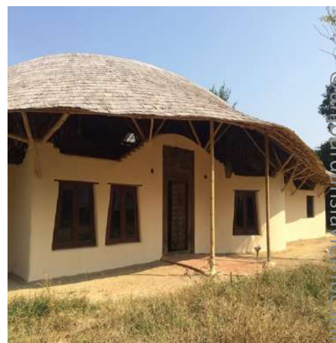
Eco village de l'espoir Baan Tribes Child : Photos non contractuelles