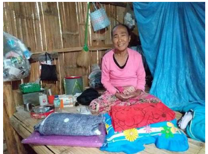
Distribution de colis alimentaire dans les tribus montagnardes de Chiang Ra, via association localei