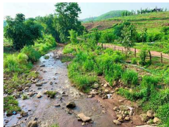
Une vallée au pied des montagnes des différentes tribus de Chiang Rai 20 Rai (32.000m 2 )