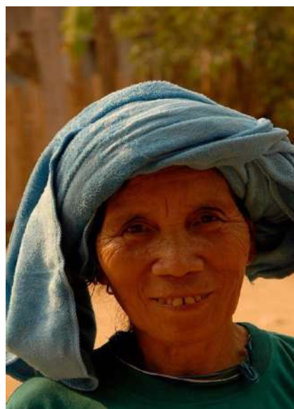
Nasi 60 ans