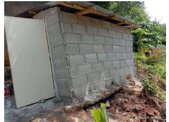
Projet réalisé en 2019 région de Chian Rai Village Djabeu Réalisation d'un bloc sanitaire en collaboration avec une association locale partenaire